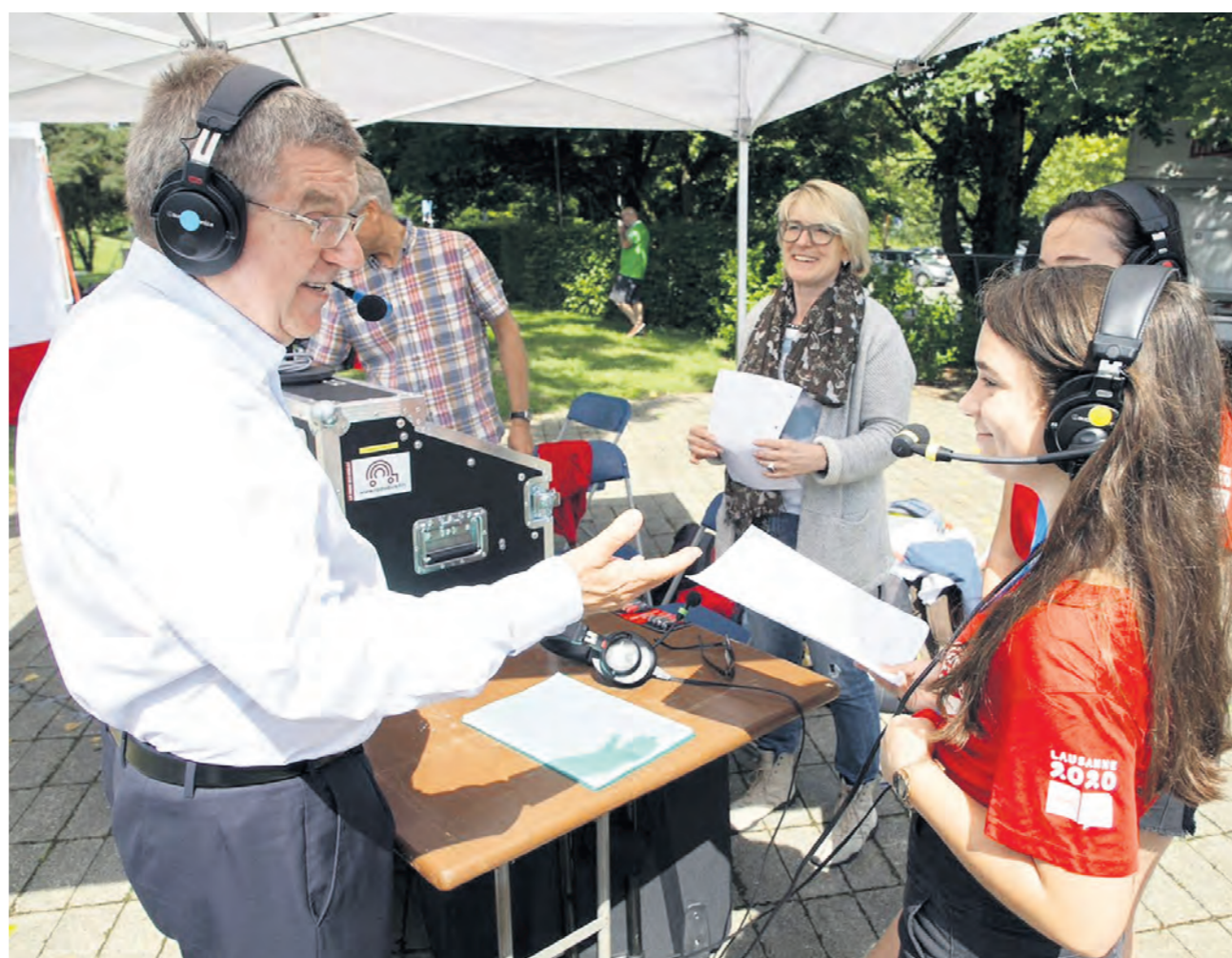
Des journalistes en herbe de RadioBus interviewent Thomas Bach, président du CIO.

C'est l'un des symboles les plus marqués d'une compétition interna-