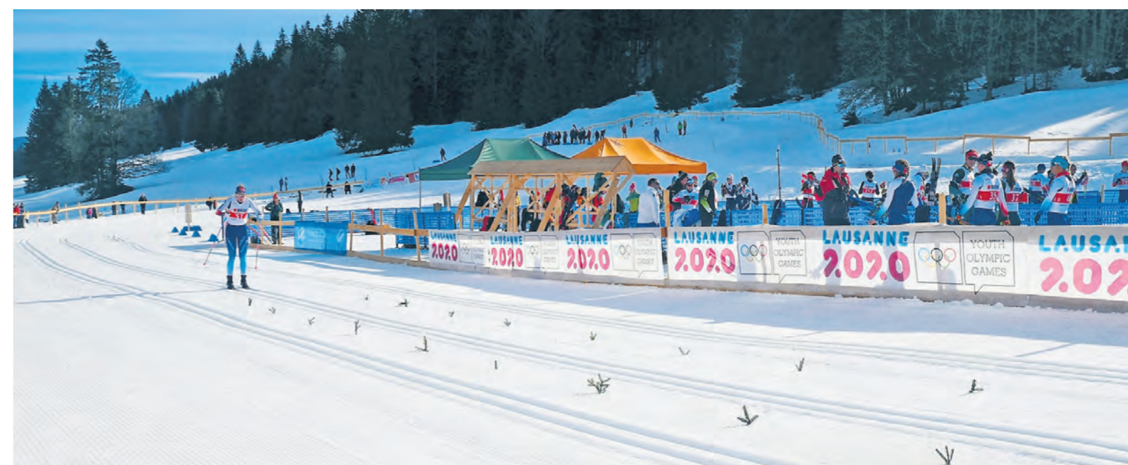
La Vallée de Joux accueillera les épreuves de ski de fond, sur un terrain difficile, avec des passages très techniques. STUDIO PATRICK JANJET