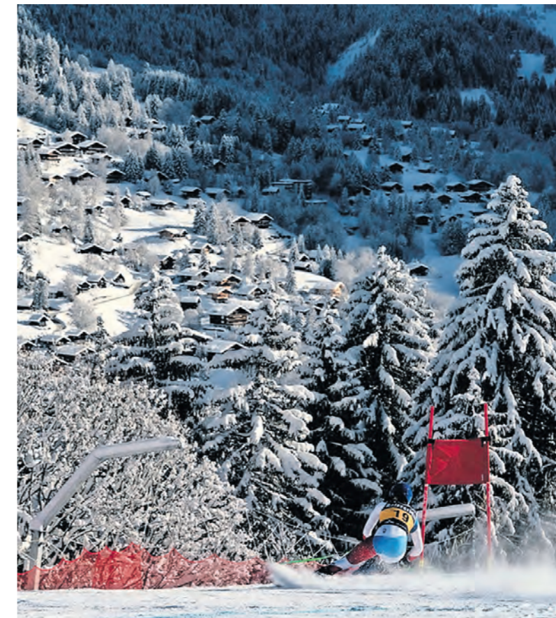
L'accès aux compétitions des JOJ sera gratuit, mais il faudra parfois s'inscrire au préalable pour accéder aux sites. BOB MARTIN

Comme leur titre le suggère, les bénévoles ne seront pas rémunérés. Tou-