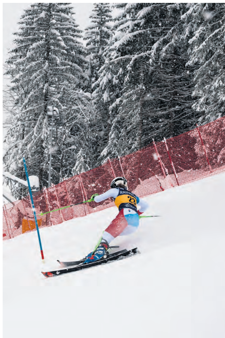
Après trente-six ans, Les Diablerets ont organisé, fin janvier, une épreuve du calendrier international de la FIS. En l'occurrence une Coupe d'Europe féminine.