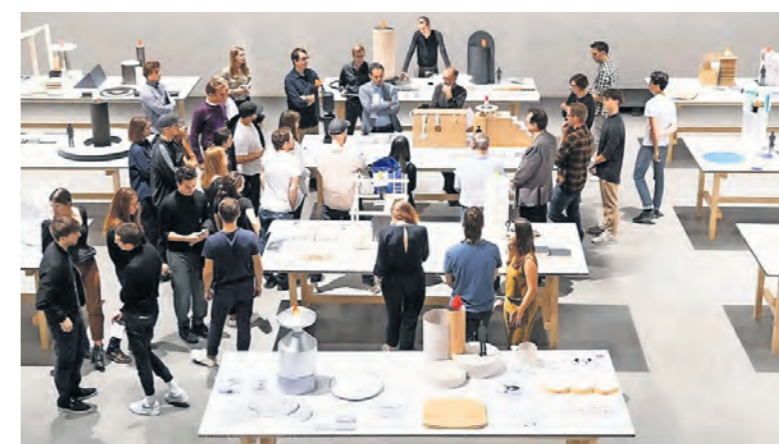
Les élèves de l'ECAL lors de la présentation de leurs projets de création du plateau des médailles.