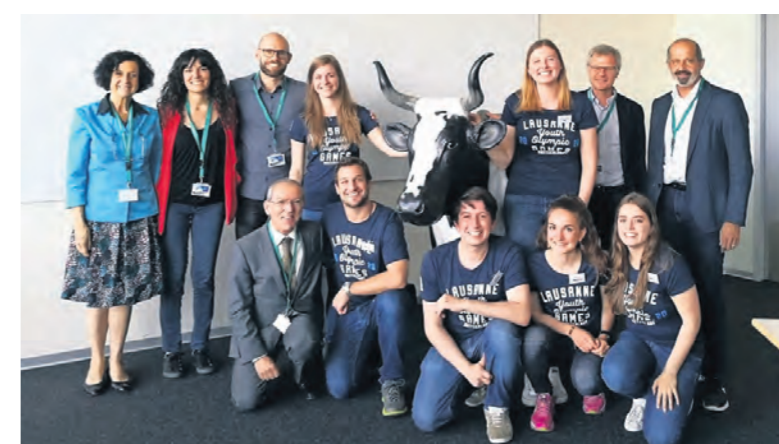
L'École hôtelière de Lausanne a participé à la préparation des JOJ en proposant une liste de services à disposition des athlètes.