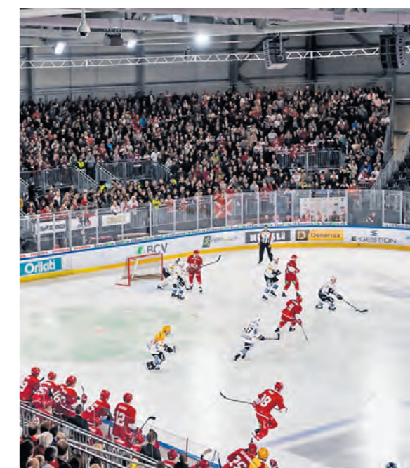
Les patinoires de Malley, la «Vaudoise Arena», en construction, et Malley 2.0, dans laquelle évolue le LHC, seront bien occupées durant les JOJ.