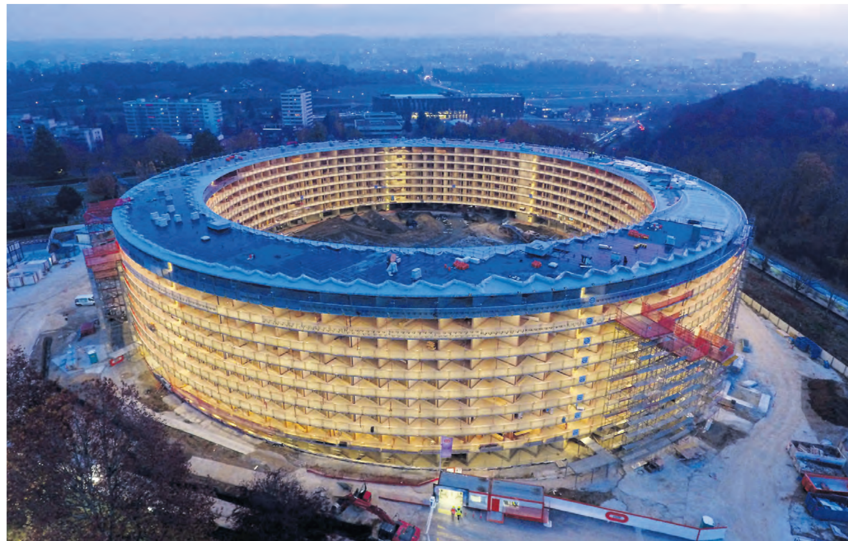
Le Vortex est l'une des réalisations les plus emblématiques de l'esprit des Jeux Olympiques de la Jeunesse. Le bâtiment servira aux étudiants des Hautes Ecoles après avoir servi pour les athlètes.