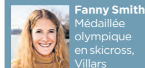
Fanny Smith Médaillée olympique en skicross, Villars

«J'ai appris à skier ici. L'idée de voir les anneaux olympiques orner ces pistes, c'est comme un rêve. On leur réserve une belle fête»