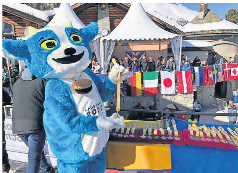
La mascotte Yodli fait connaître les JOJ tous azimuts.