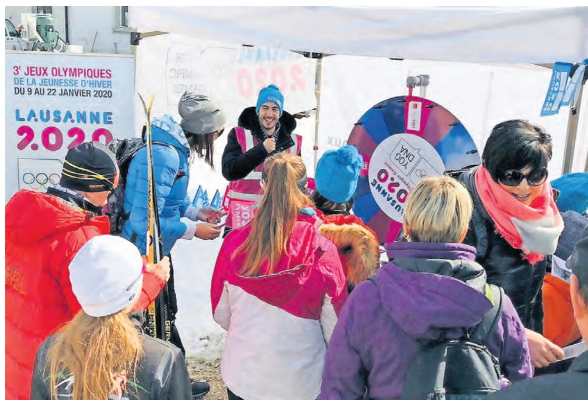
Lausanne 2020 est présente lors de nombreuses manifestations pour présenter les JOJ.