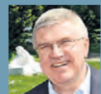
Thomas Bach Président du CIO

«Les Jeux Olympiques de la Jeunesse de Lausanne seront une référence»