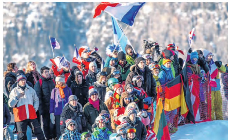
Volontaires et spectateurs venus du monde entier encouragent les athlètes avec fair-play.

L'hiver prochain, dans le cadre des JOJ, trois épreuves seront au programme. On retrouvera tout d'abord la traditionnelle épreuve individuelle, course longue distance avec un départ groupé, ses ascensions et ses portages pour un dénivelé positif de près de près de 1000 mètres, sans oublier ses descentes dans la poudreuse. Ensuite, le sprint, qui se court sur un format de séries éliminatoires de trois minutes avec six athlètes qui seront simultanément au départ. Et enfin le relais, qui se dispute en équipes de trois ou de quatre coureurs, mélangés indépendamment de la nation qu'ils représentent, sur une longueur de course relativement courte également. J.T.