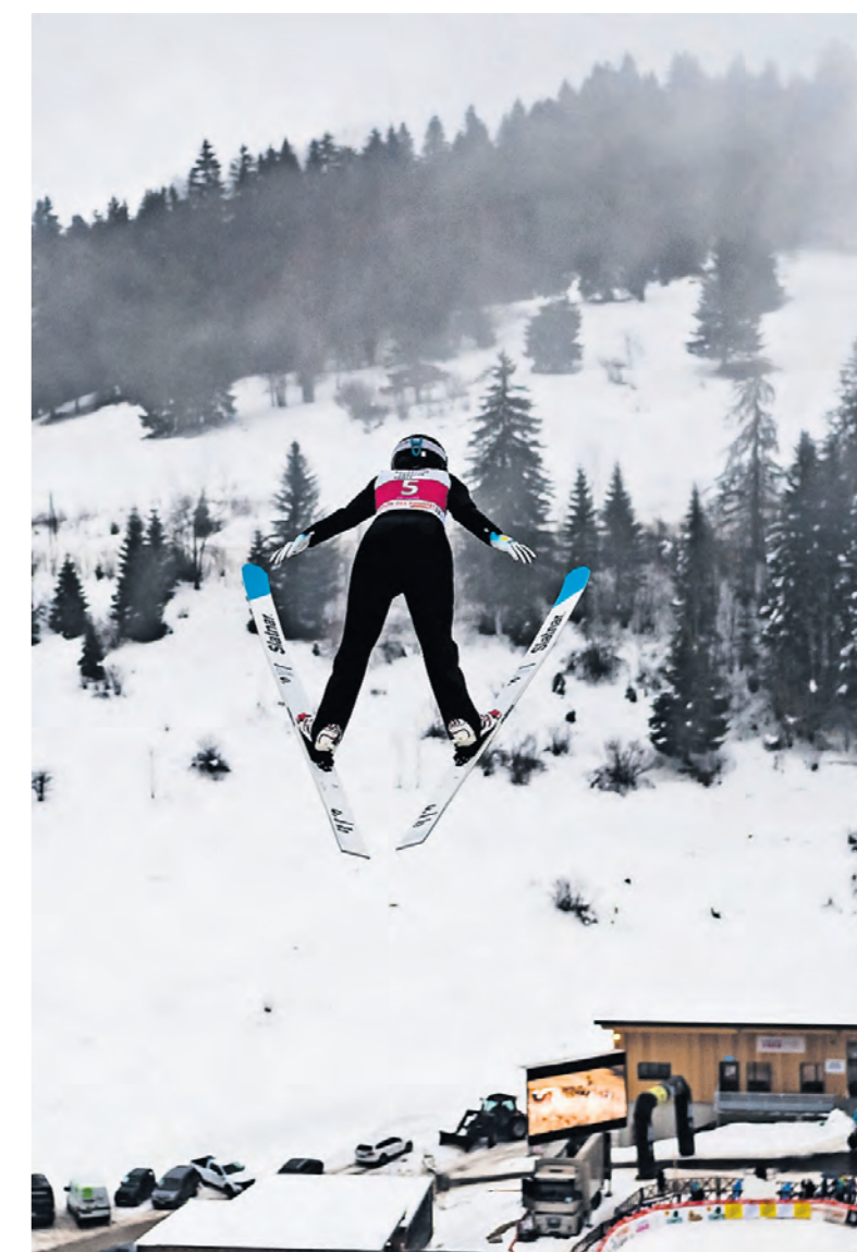
En décembre dernier, le tremplin des Tuffes, à quelques encablures de la frontière suisse, a accueilli la deuxième manche de la Coupe du monde de saut à skis féminine.