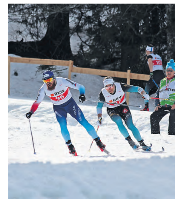
Une vue de la descente spectaculaire, rapide et technique, qui sera utilisée pour toutes les courses des JOJ à la Vallée de Joux.

Sergey Bubka Membre de la commission de coordination Lausanne 2020 CIO