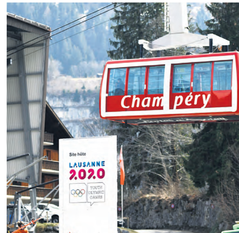
A Champéry, l'événement de Lausanne 2020 est déjà visible dans la station, par exemple via la nouvelle télécabine. Tout est prêt pour accueillir les Jeux.